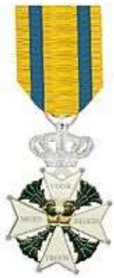
Ridderkruis der Militaire Willems-Orde