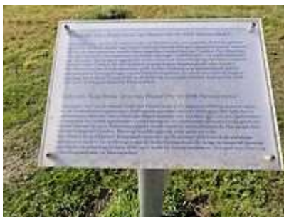
Informatie bij het Lodewijk van Hamelpad langs het Tjeukemeer nabij Echtenerbrug